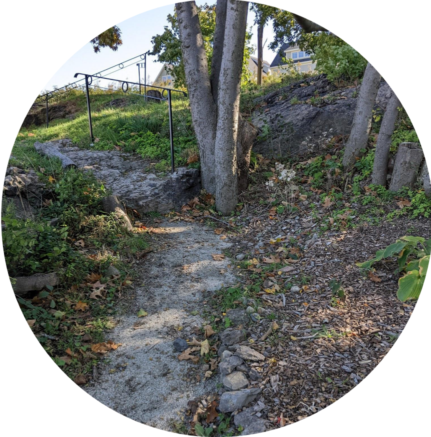
Jardín Savin Hill Wildlife, Dorchester