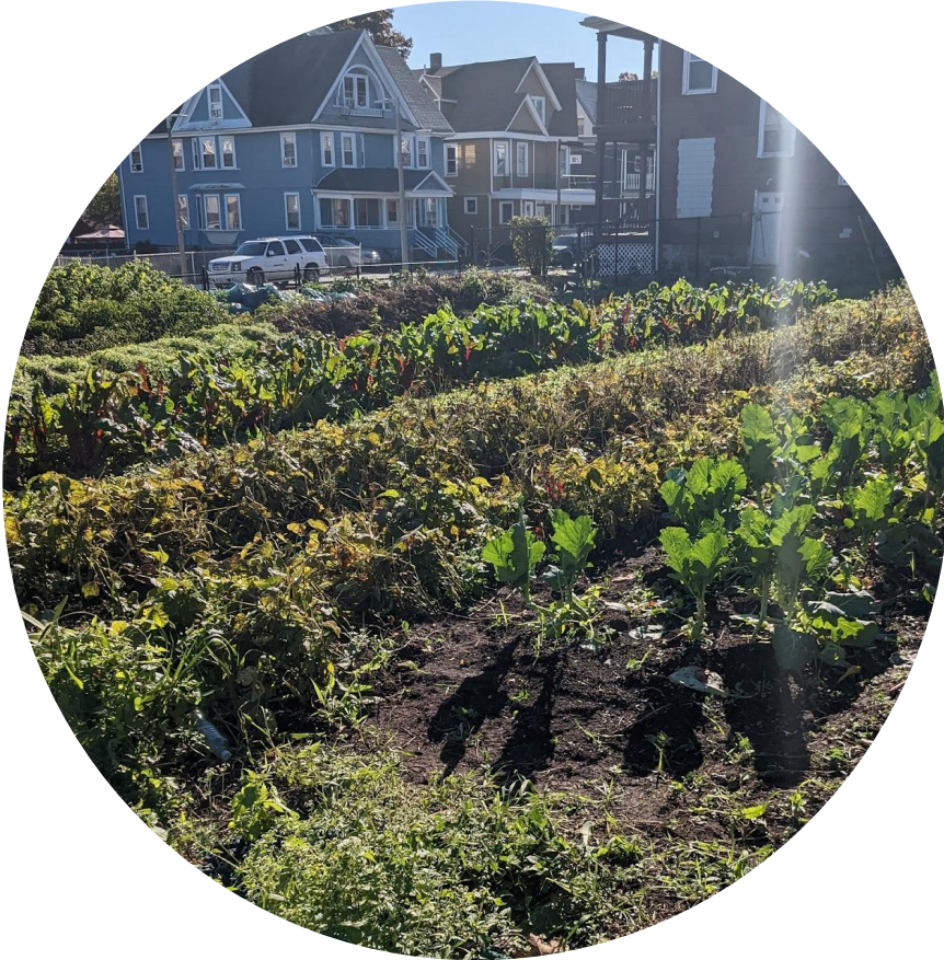
Granja East Cottage, Roxbury