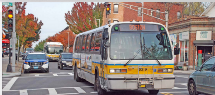
JP/Rox Transportation Action Plan