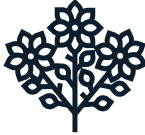
النباتات المنزلية والزهور