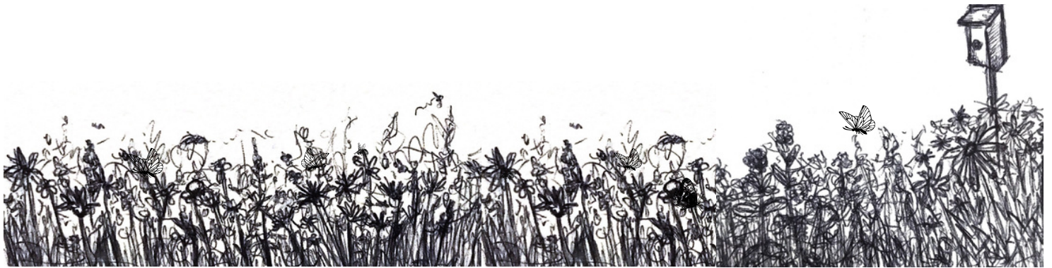
Ilustrason di Olivia Golden.